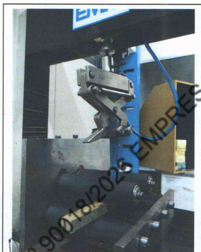
Detalhe da execução do ensaio

O ensaio tem por objetivo avaliar a colagem do sistema painel-borda. Consiste em tracionar a fita de borda com uma velocidade constante, em um ângulo reto.